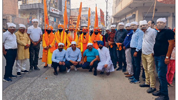
सोनीपत। नगर कीर्तन में पंज प्यारों के साथ क्लब के पदाधिकारी एवं सदस्यगण।

रोटरी क्लब सोनीपत आर्ट्स द्वारा गुरु नानक देव जी के प्रकाश पर्व के उपलक्ष्य में निकाले गए नगर कीर्तन के अवसर पर श्रद्धालुओं के बीच लंगर प्रसाद वितरण की सेवा की गई। क्लब के सदस्यों ने सड़क मार्ग पर निकले नगर कीर्तन में सम्मिलित साध संगत को लंगर प्रसाद वितरित किया। इस अवसर पर क्लब अध्यक्ष