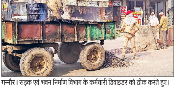
गन्नीर। सड़क एवं भवन निर्माण विभाग के कर्मचारी डिवाइडर को ठीक करते हुए।