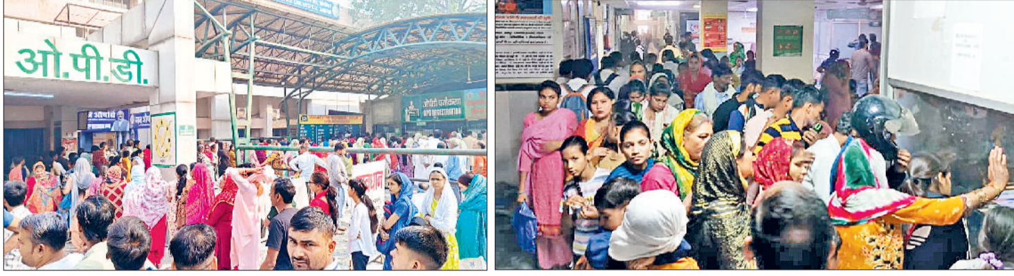
सोनीपत। रजिस्ट्रेशन काउंटर व ओपीडी में मरीजों की भीड़।