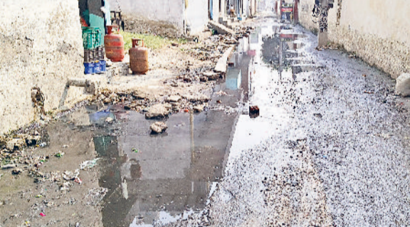
गन्नीर। नई अनाज मंडी के साथ लगती गली में भरा बरसात का पानी।

गढ़ी केसरी में स्थित श्री कृष्ण प्रणामी मंदिर व नई अनाज मंडी के साथ लगती गली में इन दिनों गंदे पानी का जमाव गंभीर समस्या बना हुआ है। गली में नालियों की सफाई और पानी की निकासी की उचित व्यवस्था न होने के कारण गंद पानी गली में भर गया है, जिससे लोगों को आवाजाही में भारी परेशानी का सामना करना पड़ रहा है। स्थानीय निवासियों का कहना है कि कई दिनों से लगातार नालियां जाम पड़ी हैं